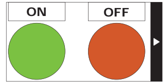
Exemple d'étiquette après découpe